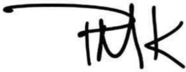
IMAGE DE RÊVE www.imagedereve.ca

16 Rue Albert-Trudel Québec, QC G2A 2R9 Tél/Fax 418-845-1397 imagedereve@videotron.ca